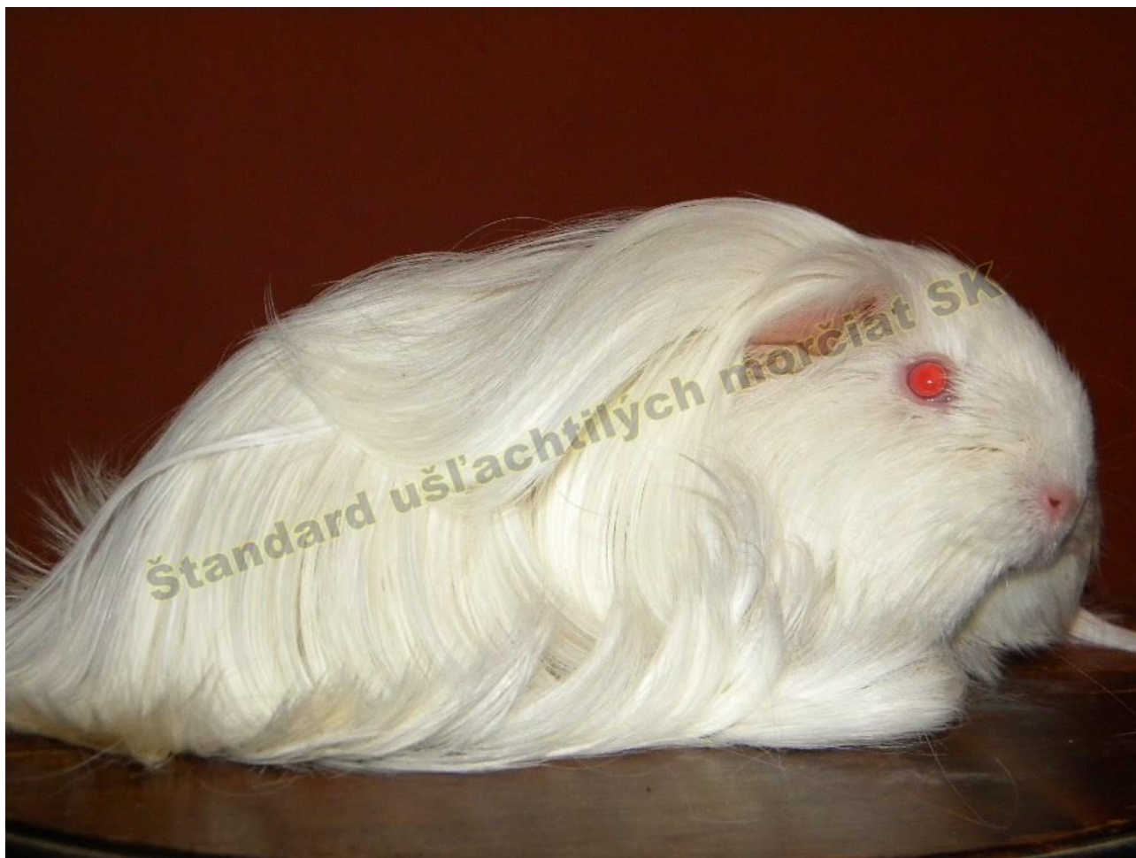
OBR. 5 BIELA ČERVENOOKÁ