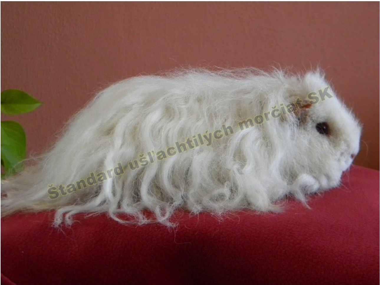
OBR. 4 BIELA TMAVOOKÁ