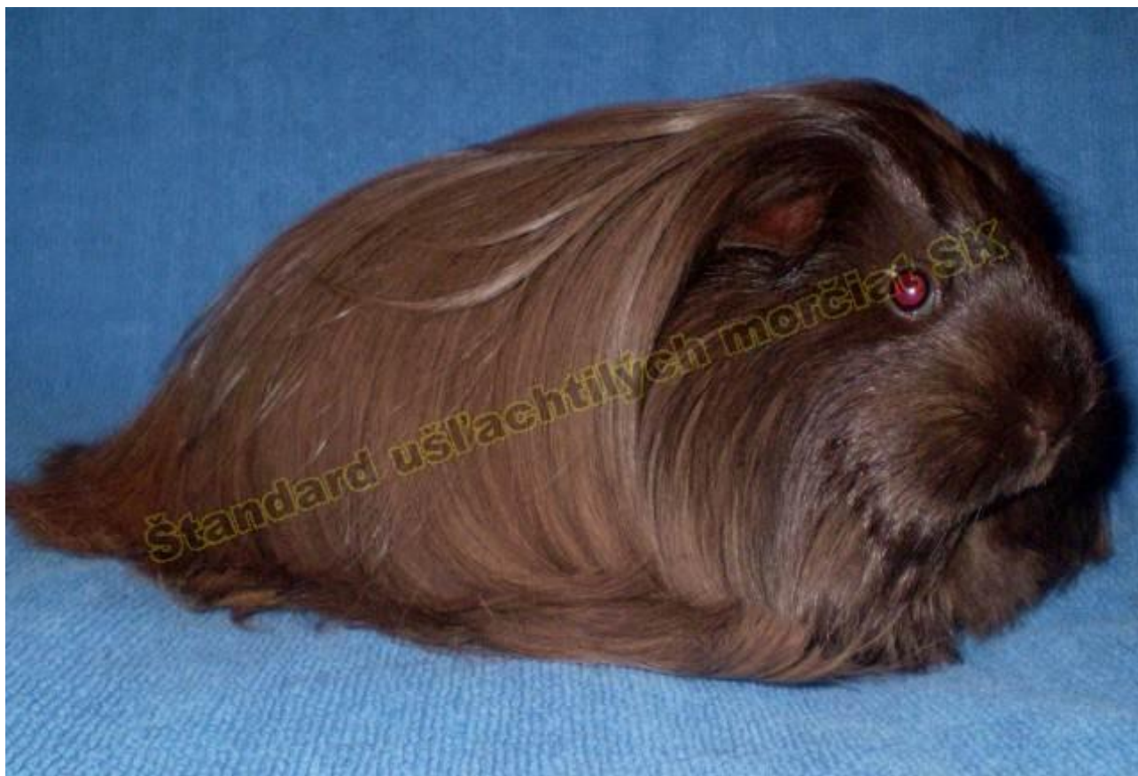
OBR. 2 ČOKOLÁDOVÁ