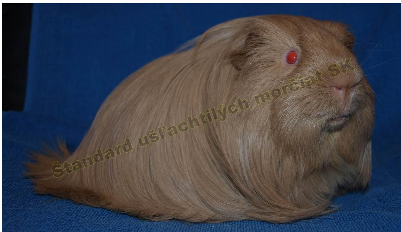
OBR. 3 BÉŽOVÁ