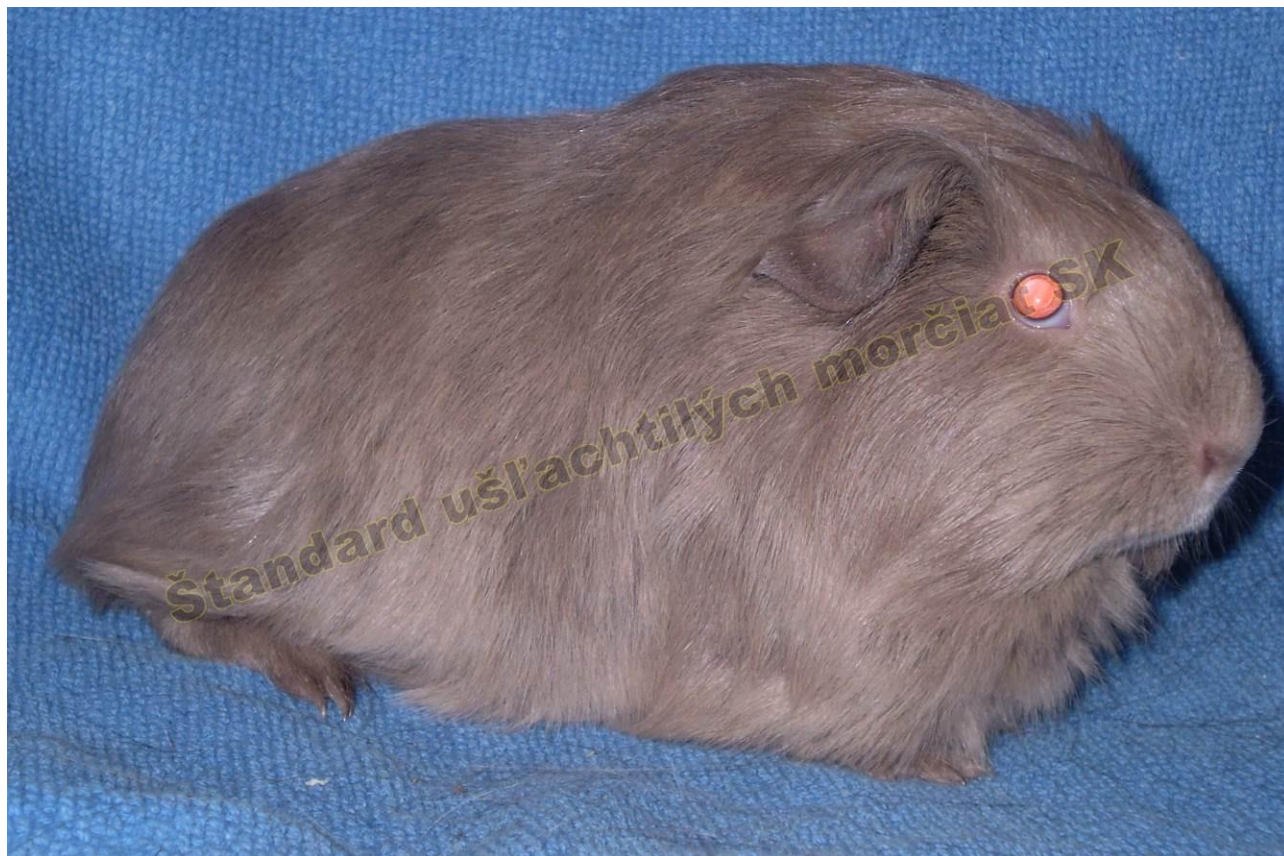
OBR. 1 SLATE