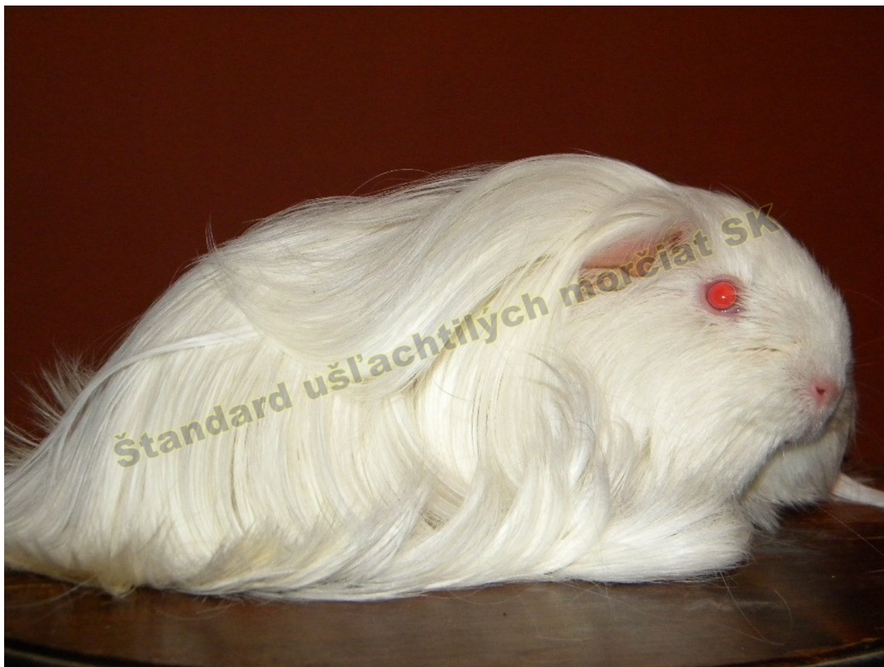
OBR. 5 BIELA ČERVENOOKÁ