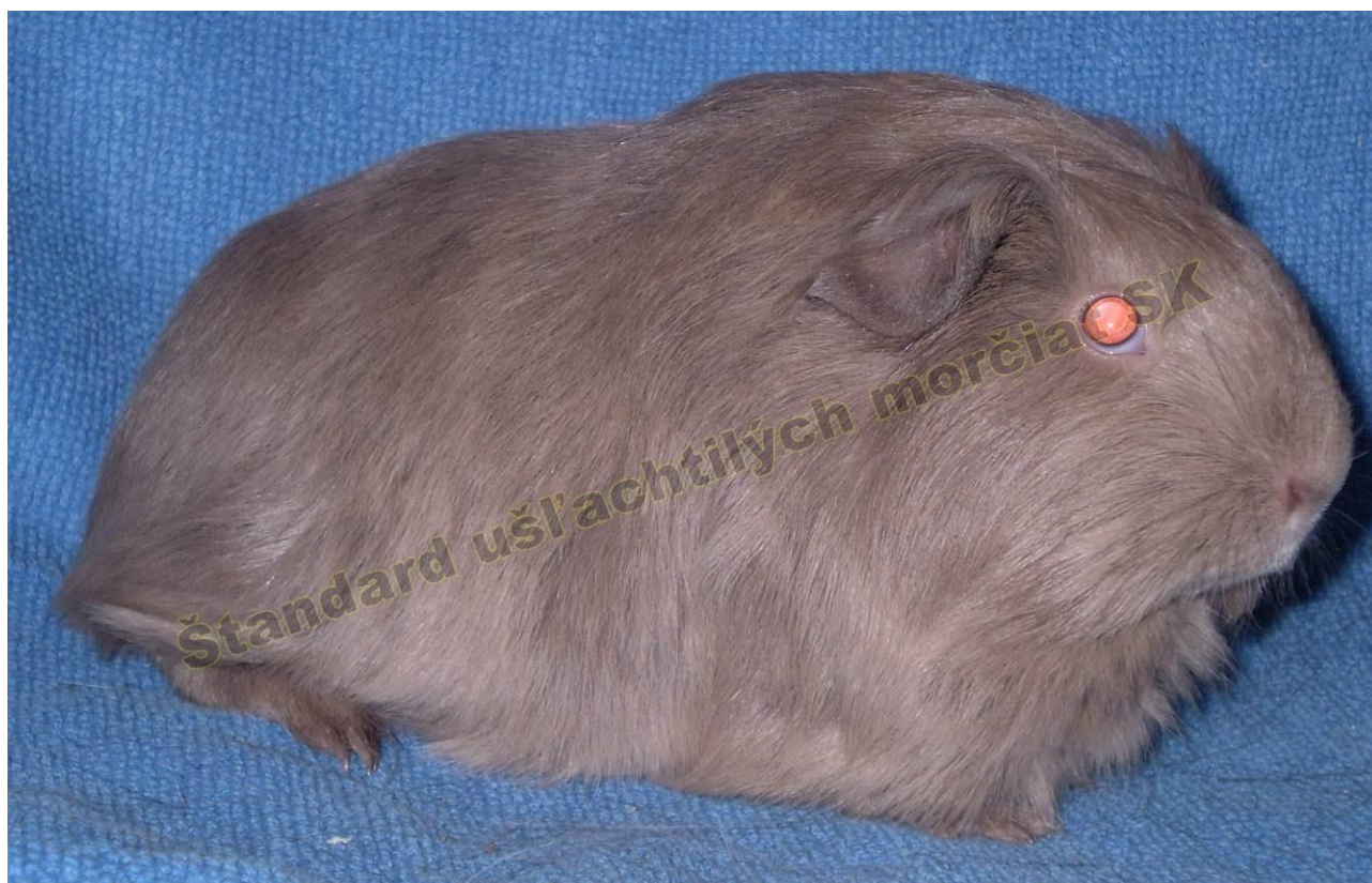
OBR. 1 SLATE