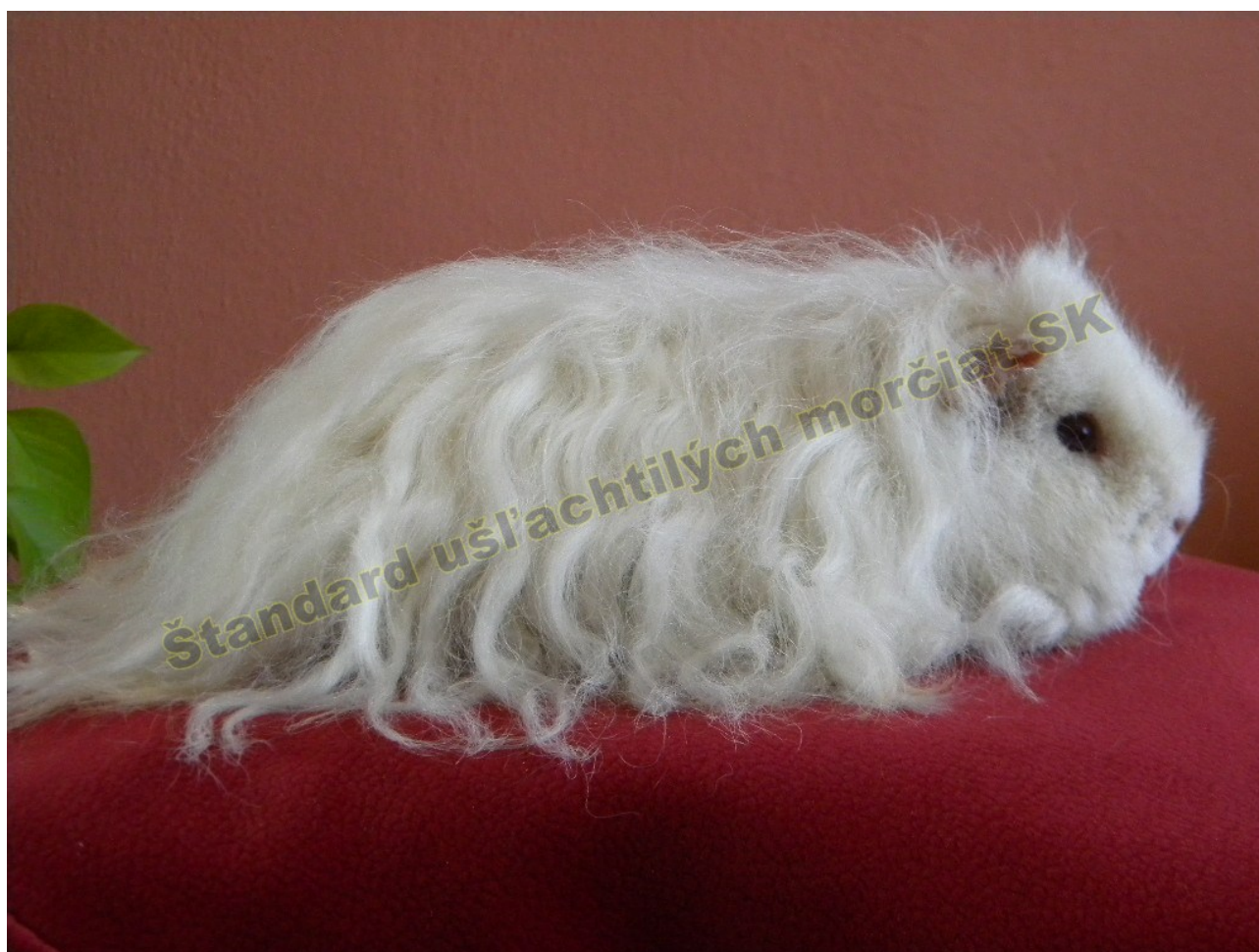
OBR. 4 BIELA TMAVOOKÁ