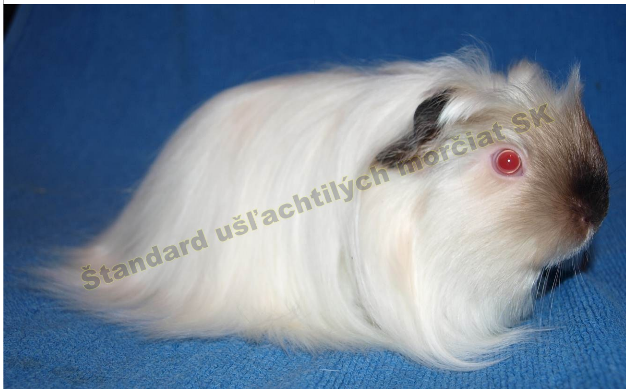
OBR. 6 HIMALAJA